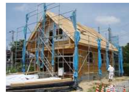
最新の全景・矩（かね）勾配が特徴

七月下旬からいよいよログ積みが始まりました。外壁下塗り塗装・電気配線工事・なども入り、一、二階床下地工事や妻壁・根太の組み立て、そして棟木と野地板・屋根下地工事へと進みます。