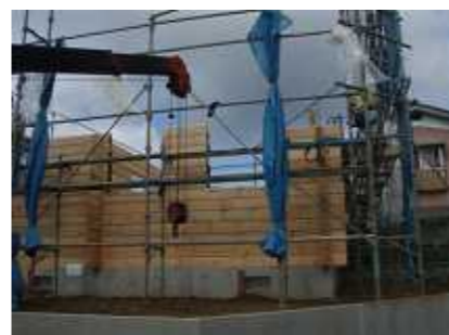
ダボ・鋼管・通しボルトで強固に。

あるとの見解で、細かい耐力壁・心力の及ぶアウトリガーなども計算式の提出が要求されました。かつてないほどの手間はかかりましたが、無事許可が下り、工事開始となりました。上の写真は地盤保証の為の工事です。