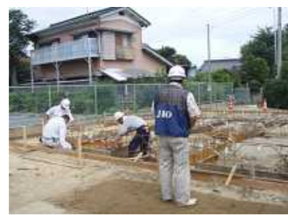
基礎工事・J10による配筋検査の様子

昨今の建築確認審査の厳密化により、小屋裏利用の二階建ログに関しては高さを高くするログ壁の積み増し（ホンカのロフティ）ホームデザインはほとんどこの仕様です）については構造計算が必要で