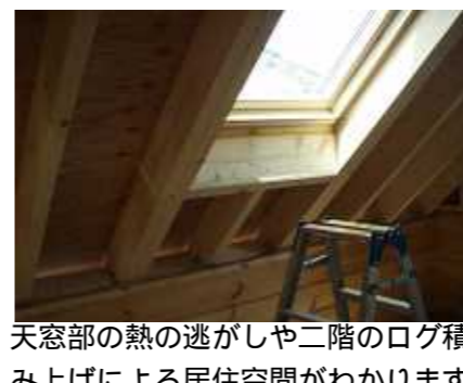
天窓部の熱の逃がしや二階のログ積み上げによる居住空間がわかります