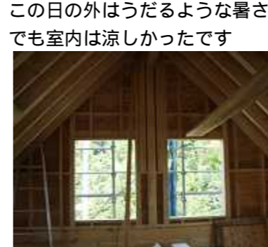
この日の外はうだるような暑さでも室内は涼しかったです

いよいよ上棟です。これからは、屋根屋・設備工事なども入ってきますので日毎に家らしくなります。