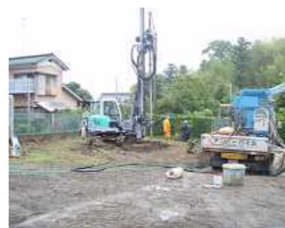
地盤（柱状改良）工事の様子6月中旬

S M 邸 ラッカウス（ロフティ）ホー ム（二階建 26.9坪） 建築地：市原市馬立