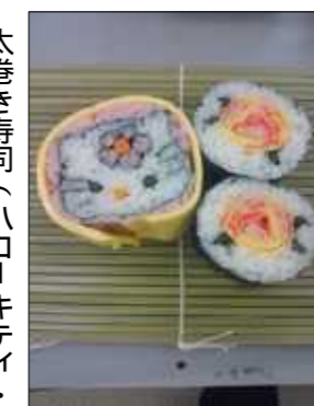
太巻き寿司（ハロッキー・バラ）

○豊かな自然と四季を通じ豊富な食材に恵まれたところ ○食（住）と農が近接し、都市と農山魚村が共存する、地域環境 ○地域色豊かな郷土料理、伝統的な食産業の歴史が息づく